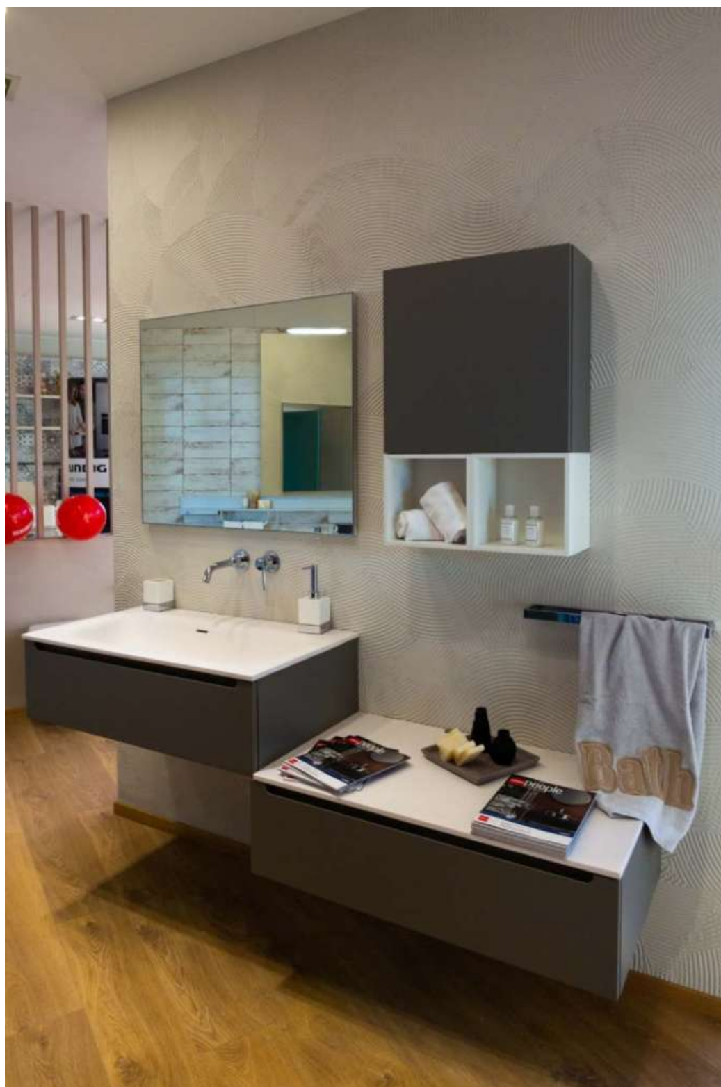
Cucina, bagno, living. Il nuovo Scavolini Store Busca espone 9 cucine, 4 bagni e 3 living Scavolini

mantenere forte la nostra identità, soprattutto nel rapporto con il cliente: con chi entra nel nostro punto vendita cerchiamo di instaurare quella relazione umana diretta, coinvolgente e basata sulla fiducia che le scelte riguardanti la casa meritano. Poi naturalmente ci sono i servizi più aggiornati e affidabili, dalla progettazione 3D al post vendita, ma chi compra qui... compra anche un pezzo di noi».