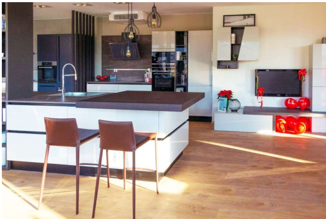
Una storia di famiglia. La conoscenza con Scavolini della famiglia titolare dello Store Busca risale ai primi anni Sessanta e oggi è sfociata in una partnership importante

Nel nuovo Store, ad esempio, c'è uno spazio dedicato all'innovativo software progettuale Virtuo , che fa vivere ai clienti Scavolini l'emozione di ritrovarsi immersi e interagire nel progetto della loro futura casa. «Un plus che attira e appassiona la clientela più giovane ma che risulta molto coinvolgente anche per chi è meno avvezzo alle nuove tecnologie. L'espansione di Scavolini dalla cucina al living e al bagno ci permette inoltre di accompagnare il cliente in un approccio coordinato e completo agli ambienti», conclude con convinzione la titolare dello Scavolini Store Busca.