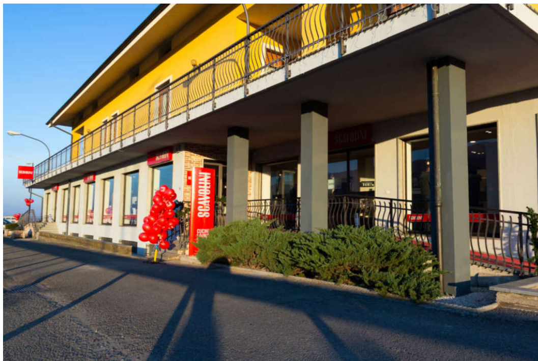
Il nuovo Scavolini Store Busca, inaugurato nel dicembre 2018, si estende su un'area di 250 mq

«La conoscenza con Scavolini risale proprio ai primi anni Sessanta, quando nostro padre decise di iniziare il commercio di mobili. Individuò una bella sede con tre vetrine su strada, a Saluzzo: in una ci mise in esposizione la cucina, in un'altra il salotto e nella terza la camera da letto. La cucina era una Scavolini: allora arrivavano da Pesaro i primi modelli di quelle che si chiamavano cucine componibili, come la "svedese". Erano già all'avanguardia allora. «Una volta all'anno papà andava a Pesaro alla grande fiera dove si incontravano i produttori: Valter ed Elvino Scavolini accoglievano i distributori come in famiglia. Anche questo è un tratto che è rimasto nel dna di questo brand, con il quale è ancora facile e diretto il dialogo. Anche se ora Scavolini è una realtà grande e ancora più strutturata, riesce a mantenere con noi un rapporto personale: ci sono le persone, competenti e affidabili del team e anche della dirigenza, che sono sempre pronte all'ascolto e al dialogo».